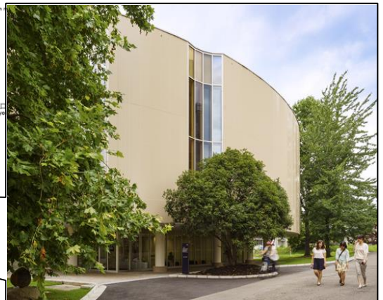
星陵会館(オーデトリウム)外観